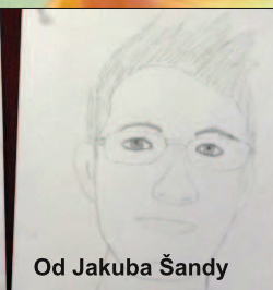
Od Jakuba Šandy