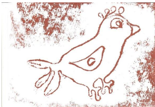
Autor: Jiří Šmolík