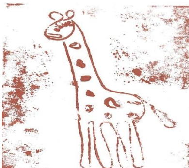
Autor: Jakub Hyna